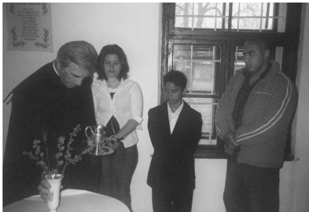
Keresztelő a vásárosnaményi unitárius gyülekezeti teremben