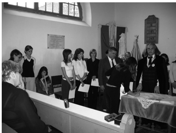
A Jótevők napja